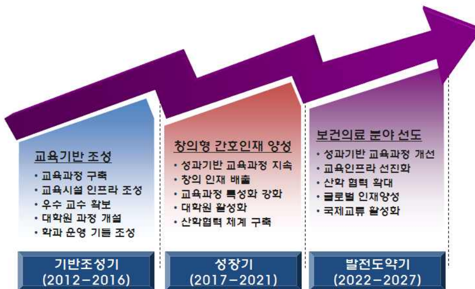
그림. 충북대학교 간호학과 단계별 발전계획

충북대학교 간호학과는 장·단기 발전계획을 위한 3단계 전략을 수립하고, 단계별 발전계획 및 추진내용을 구체화하여 실행해 왔다[그림]. 각 단계별 전략을 살펴보면 다음과 같다.